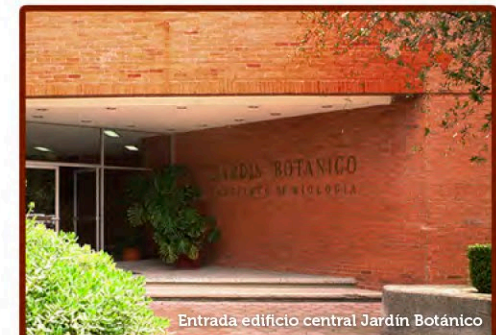
Entrada edificio central Jardín Botánico