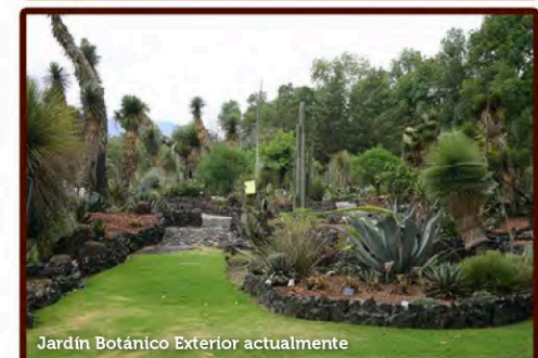
Jardín Botánico Exterior actualmente