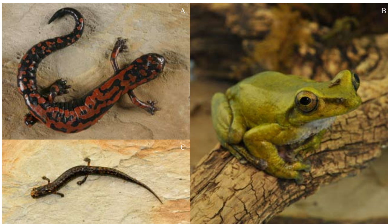
Figura 1. A, Bolitoglossa lincolni ; B, Charadrahyla taeniopus macho y C), Parvimolge townsendi.

Caldwell, 2009). Los huesos calcáneo y astrágalo se han alargado añadiendo un segmento más a las extremidades posteriores. En la región sacra las vertebrales caudales se han fusionado formando el urostilo, y junto con el ilion conforman una estructura muy resistente al momento del salto (Halliday y Adler, 2007).